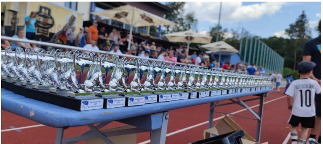
Bild oben: Es gab für jeden etwas zu gewinnen beim diesjährigen Sommerturnier des SC Olympia. Die Organisation unter der Leitung von Jugendleiter Jonas Schmittinger machte das Turnier für alle zum Erlebnis.